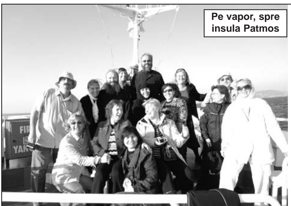
Pe vapor, spre insula Patmos