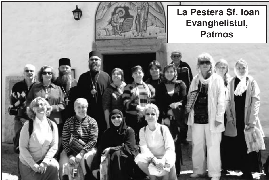
La Pestera Sf. Ioan Evangelistul, Patmos