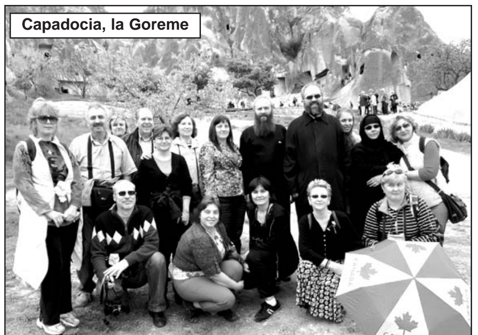
Capadocia, la Goreme