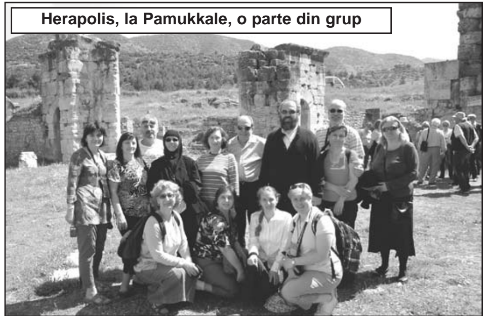
Herapolis, la Pamukkale, o parte din grup