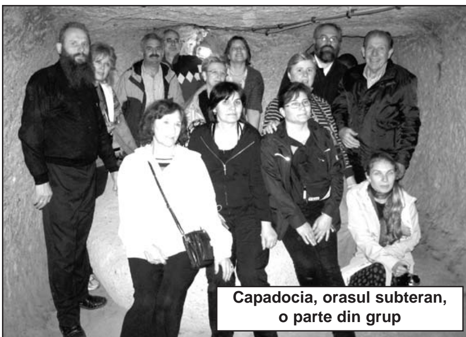
Capadocia, orasul subteran, o parte din grup