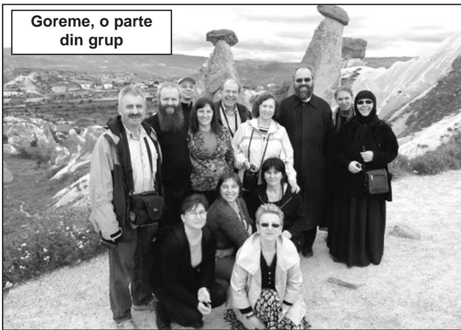
Goreme, o parte din grup